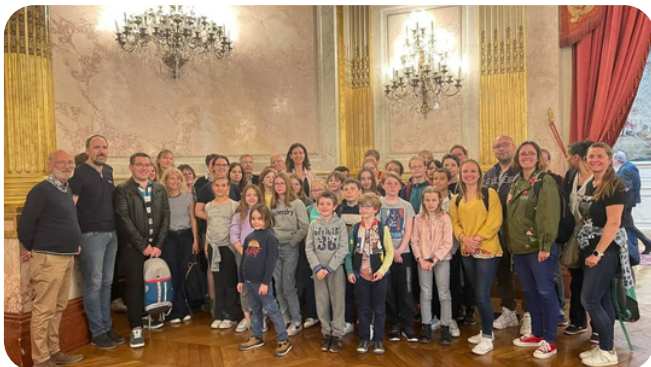
Mercredi 3 mai , le Conseil Municipal des Jeunes a visité l'Assemblée Nationale, accueilli par notre Députée Charlotte Parmentier-Lecocq.