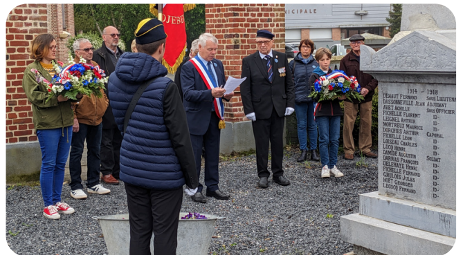
Lundi 8 mai , M. le Maire, le président des Anciens Combattants ainsi que des habitants se retrouvaient au monument aux morts de Bachy en souvenir de la capitulation définitive de l'Allemagne nazie.