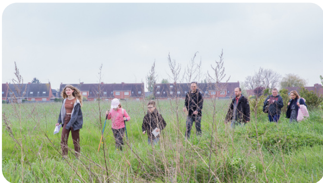
Lundi 1er mai , Vivons Bachy organisait sa 8ème marche du muguet accueillant de nombreux participants.