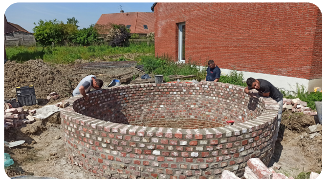
Vendredi 19 mai , les travaux de restauration de la glacière du château des Tenremonde ont démarré.