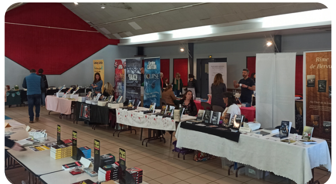
Samedi 13 mai , Festy Bachy organisait son premier salon du livre qui accueillait 18 auteurs de la région. Vous pouvez retrouver leurs livres à la médiathèque.